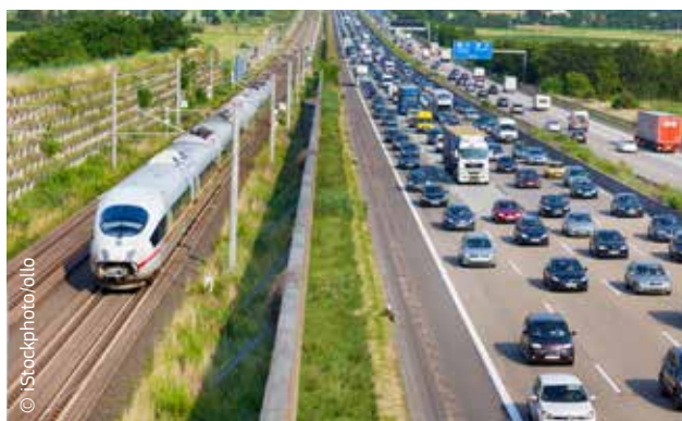
El transporte es una de las principales fuentes de emisiones de gases de efecto invernadero.

La hoja de ruta de la Comisión para avanzar hacia una economía hipocarbónica competitiva en 2050 y el Libro Blanco sobre el transporte señalan que el sector del transporte en su conjunto debería reducir para 2050 sus